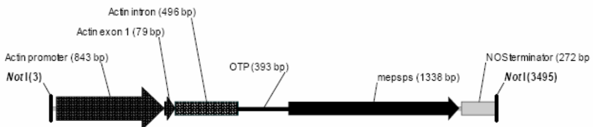
Figur 2. Rekombinant DNA-fragment i maisens genom.

Molekylærbiologiske analyser viser at det rekombinant DNA-fragment i planten inneholder seks påfølgende områder som stammer fra 3,49 kb NotI -restriksjonsfragment fra plasmidet pDPG434. Kopiene fra dette 3,4 kb rekombinante DNA-fragmentet blir av Syngenta benevnt som Copy 1 til 6. Southern-blot analyser viser at disse kopiene nedarves som et enkelt lokus.